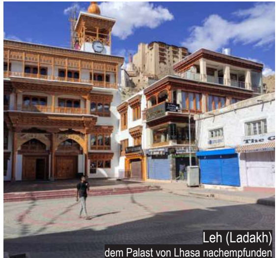
Leh (Ladakh) dem Palast von Lhasa nachempfunden