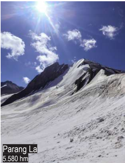
Parang La 5.580 hm