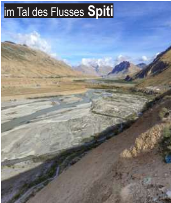
im Tal des Flusses Spiti